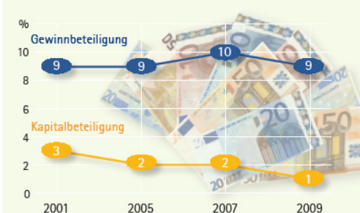
Abbildung 1 Betriebe in Deutschland, die ihre Beschäftigten am Gewinn und Kapital beteiligen 2001 bis 2009, Anteile in Prozent